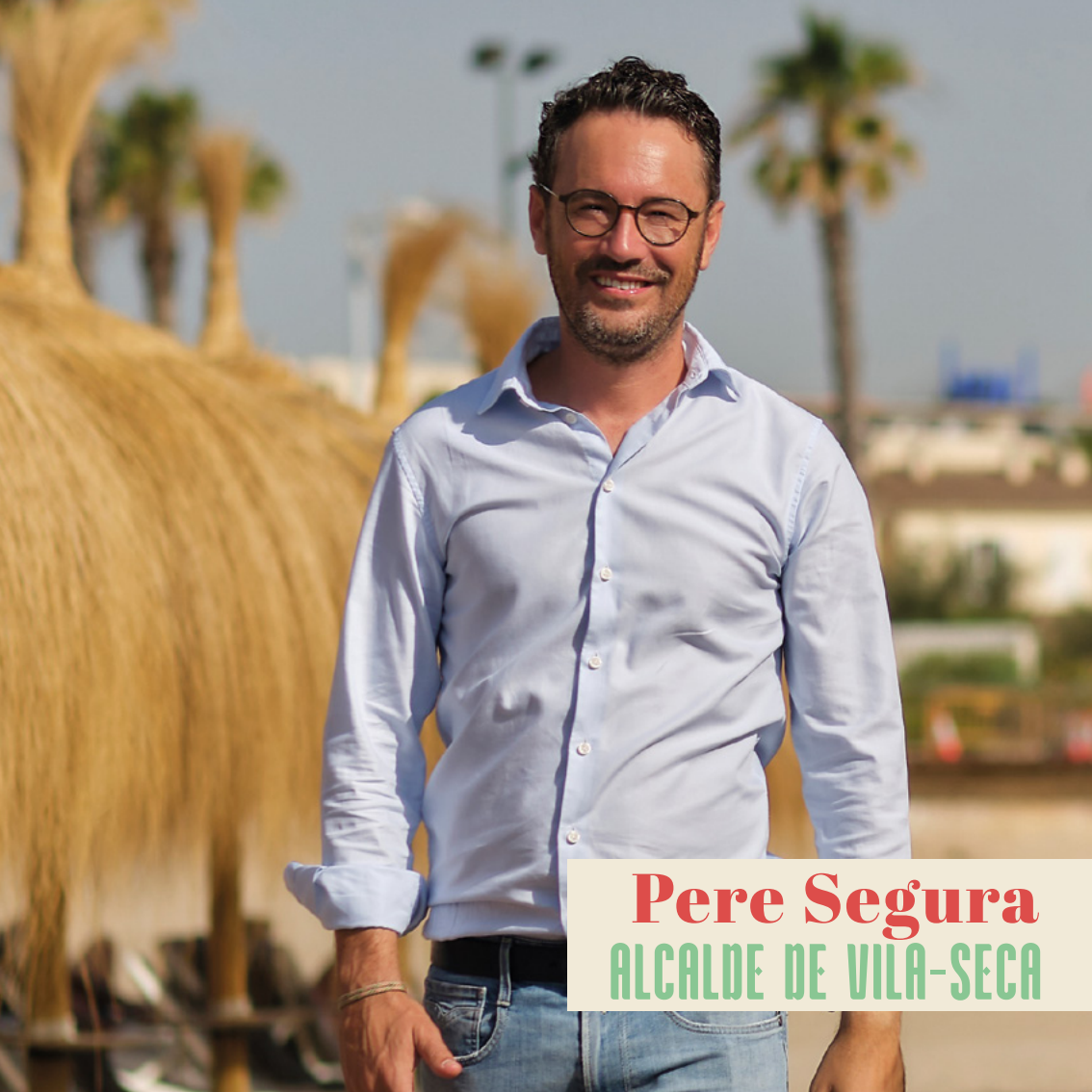
Pere Segura ALCALDE DE VILA-SECA