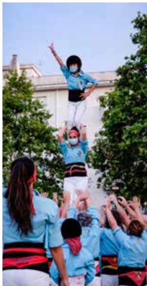
Xiquets de Vila-seca