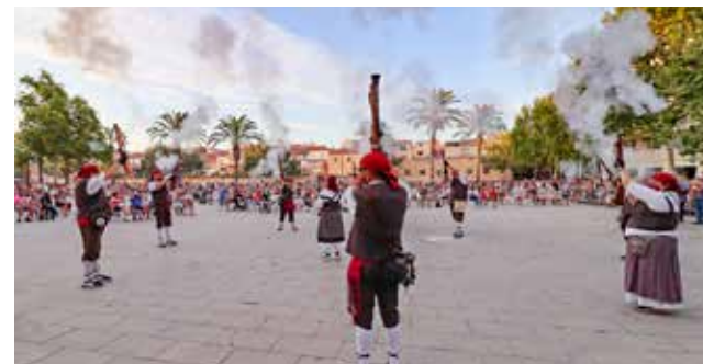
Trabucaires del Comú de Vila-seca

Carrer de Sant Pere Concentració del Ball de Diablers