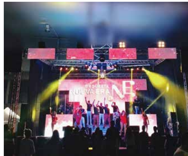
Orquesta Nueva Era