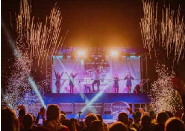
Masandmasshow Tour bus Open Air