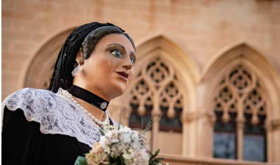
Gegants de Vila-seca