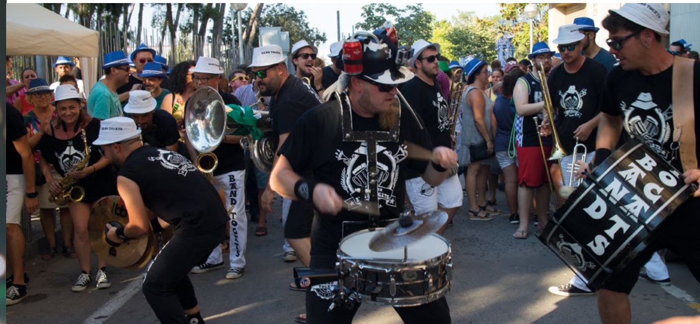
Txaranga Band Tocats

Rentar les mans sovint i/o desinfectar-les amb gels hidroalcohòlics